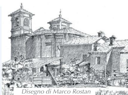
Disegno di Marco Rostan

Diacono: Dario Tron dtron@chiesavaldese.org